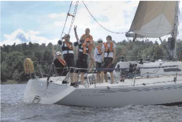
Glada vinnare på Comvision

För att hålla nere medelåldern på besättningarna kommer nästa år alla båtar med minst två besättningsmedlemmar under 5 år få sitt lystal sänkt med 0,01